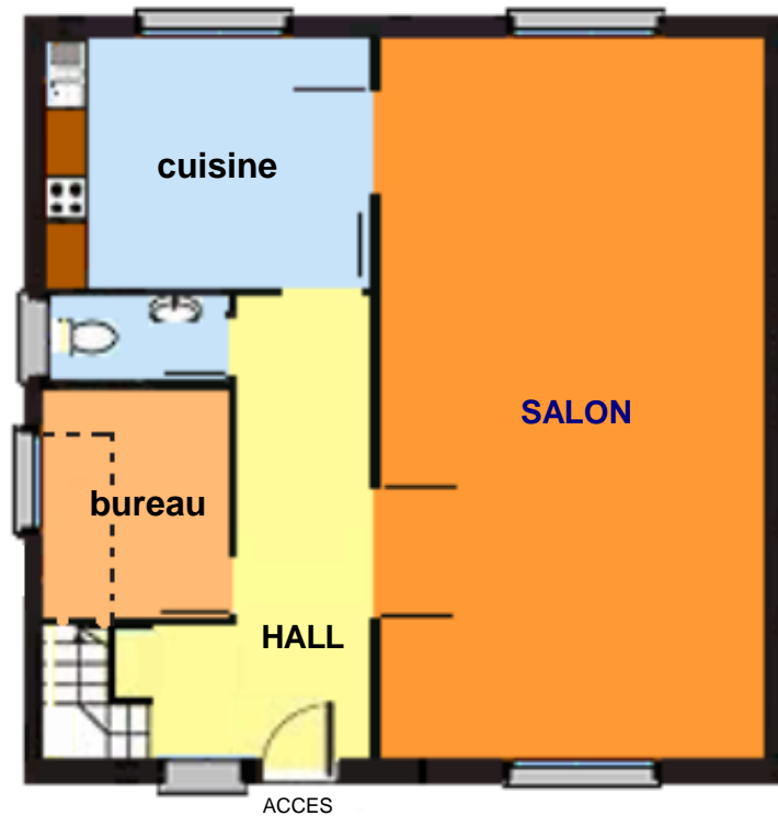
Rez de jardin

PLAN - PLD – 6 étage - dimensions = 9.18 m x 9.18 m – surface = 168.54 m 2 – Livré avec murs ossatures péri métrique et refends, isolation laine semi rigide, par vapeur, par pluie, Plancher étage, charpente, escalier.