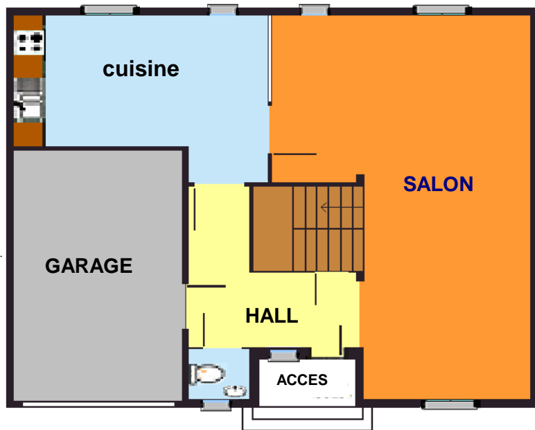
Rez de jardin

Livré avec murs ossatures péri métrique et refends, isolation laine semi rigide, par vapeur, par pluie, plancher étage, charpente, escalier